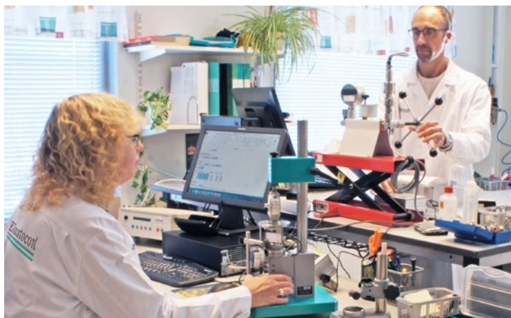
Det allmänna laboratoriet för kalibrering vid 23 °C. Utöver detta har vi ett konstant- rum för kalibrering av längd vid 20 °C ± 0,5 °C, samt ett rum för temperatur- kalibrering.

Mätosäkerheten är den osäkerhet i kalibreringsresultatet som finns efter kalibreringen. Mätosäkerheten beräknas för varje mätsituation. I osäkerheten ingår bl a normalens noggrannhet, det kalibrerade instrumentets upplösning, samt omgivande faktorer som temperatur mm.