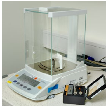
Kalibrering av laboratorievåg.

I samarbete med annat kalibreringsföretag kan vi även erbjuda ackrediterad kalibrering av referensvikter.