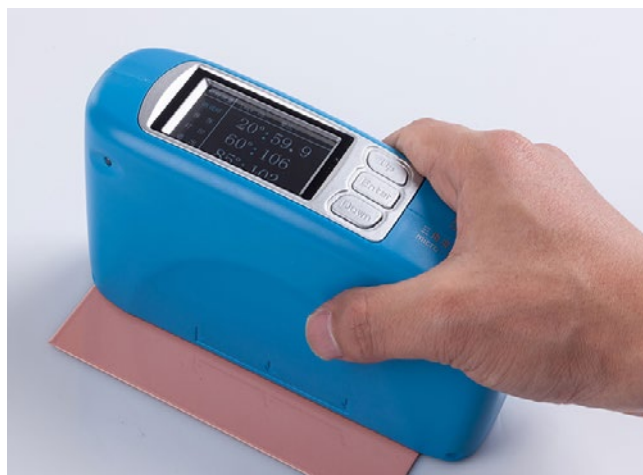
Glansmätaren med olika mätvinklar: 20°/60°/85°.