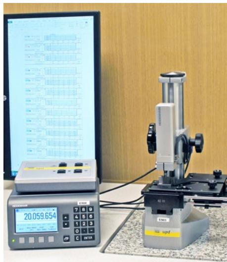
Kalibrering av passbitar i passbitskomparator.

Passbitar, ringar och tolkar kalibreras bara i vårt kalibreringslaboratorium eftersom stora krav ställs på mätmiljö och utrustning.