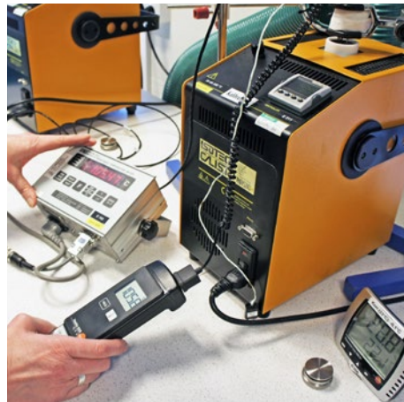
Kalibrering av temperatur i minivätskebad.

I fält använder vi blockkalibrator vilket ger en något sämre noggrannhet, men är behändigare i fält.