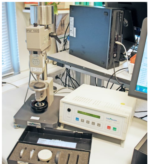
Kalibrering av referensblock.

Referensblock för Shore och IRHD kalibrerar vi i vårt laboratorium.