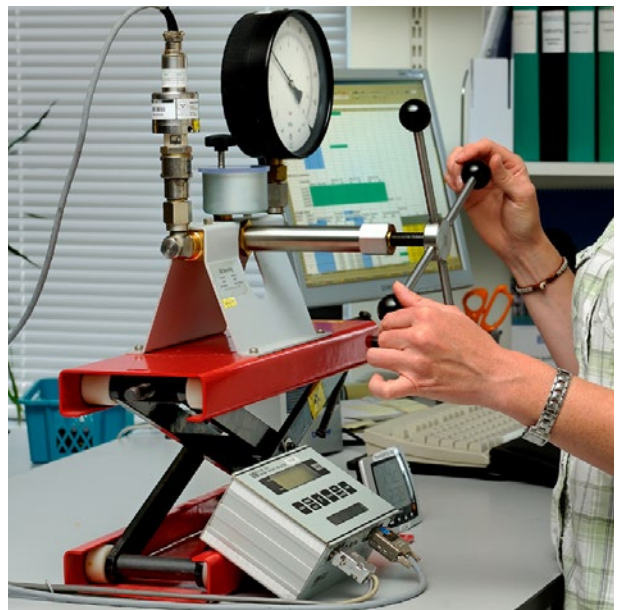
Kalibrering av manometrar.