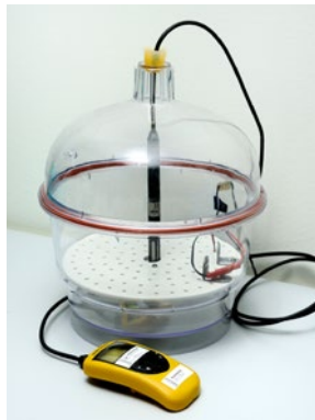
Kalibrering av fuktmatrare.

Hygrometrar kalibrerar vi i vårt laboratorium, medan klimatskåp oftast görs i fält av praktiska skäl.