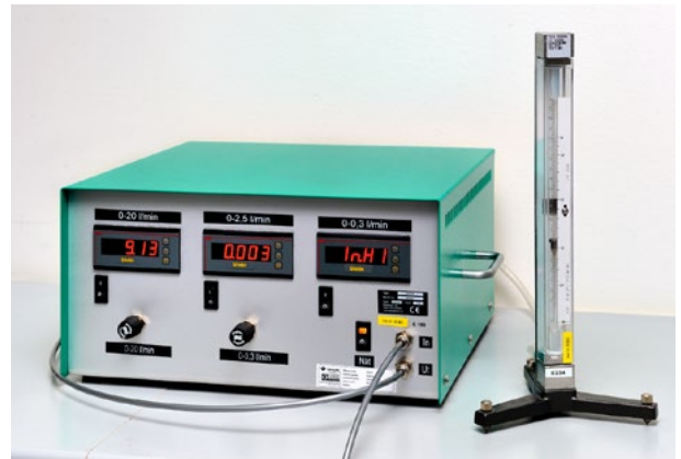
Kalibrering av svävkroppsmätare.