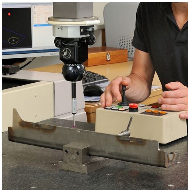
Uppmätning av utfallsprover.

Vi hjälper även till med mätteknisk rådgivning inför mätningar.