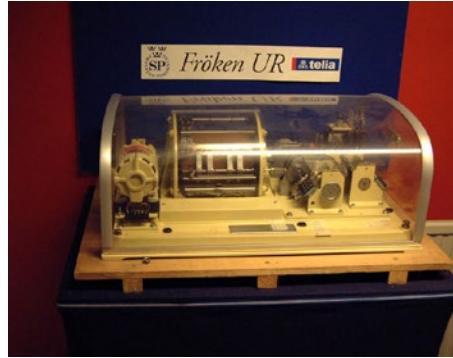
Den gamla pensionerade "Fröken Ur", hittar du på RISE Research Institutes of Sweden i Borås, där även den nya "Fröken" finns.