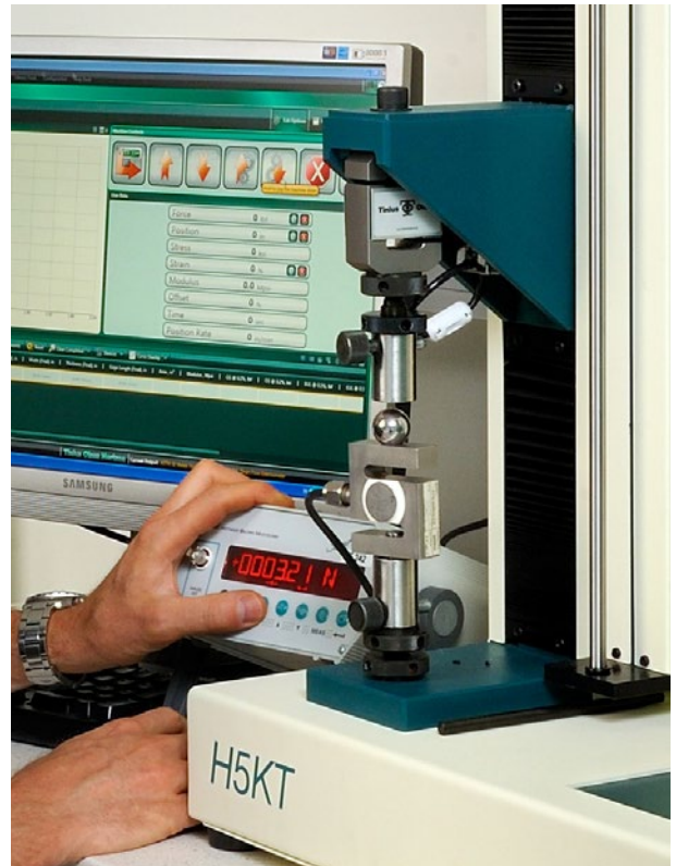
Kalibrering av dragprovare.

Flödesmätare för åldrings-skåp och analysinstrument kan vi kalibrera för flöden upp till 20 l/min.